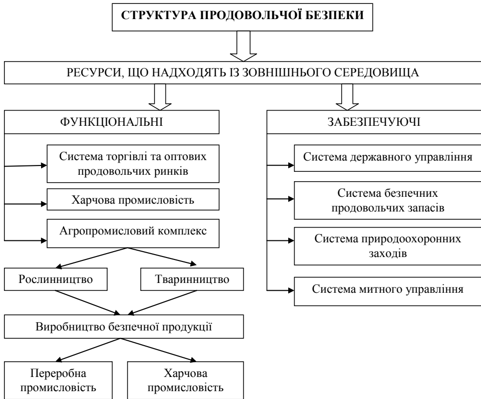
Рис. 1. Структура продовольчої безпеки