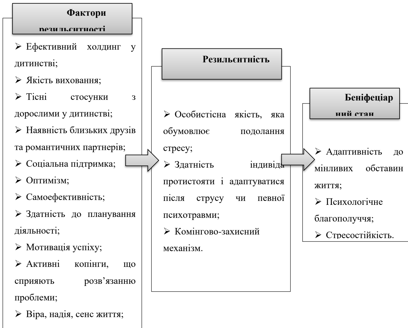
Рисунок 1.1. Фактори, психологічний зміст та вплив резильєнтності особистості.

Метааналіз досліджень резильєнтності, проведених Дж. Річардсоном, А. Мастеном та Г. Лазос дозволив виділити внутрішні та зовнішні фактори резильєнтності, а також конкретні «вигоди» резильєнтності, тобто ті стани особистості та результати діяльності суб'єкта, які досягаються завдяки розвинутій резильєнтності (рис.1.1) [28, с. 45].