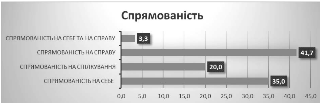
Рис. 1. Розподіл досліджуваних за спрямованістю (Опитувальник Смекала-Кучера)

У результаті аналізу отриманих даних ми можемо зробити такі висновки: до першого рангу ввійшли такі цінності як любов; здоров'я; наявність хороших і вірних друзів; матеріальне забезпечення; щасли-