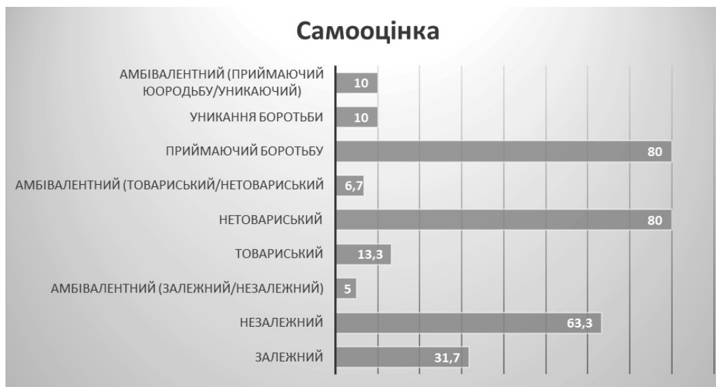
Рис. 3. Розподіл досліджуваних за самооцінкою (Опитувальник В. Стефансона (Q-сортування))

Порівняння результатів до тренінгу та після тренінгу двох груп показали такі результати. В експериментальній групі відбулися зміни: спрямованість на себе та спрямованість на справу зменшилась, спрямованість на спілкування збільшилась, також зникла роздвоєність спрямованості на себе та справу. Можемо сказати, що програма тренінгу позитивно вплинула на досліджуваних. В контрольній групі також відбулися зміни: значно знизилася спрямованість на себе, з'явилася спрямованість на спілкування та підвищився відсоток спрямованості на справу. Може-