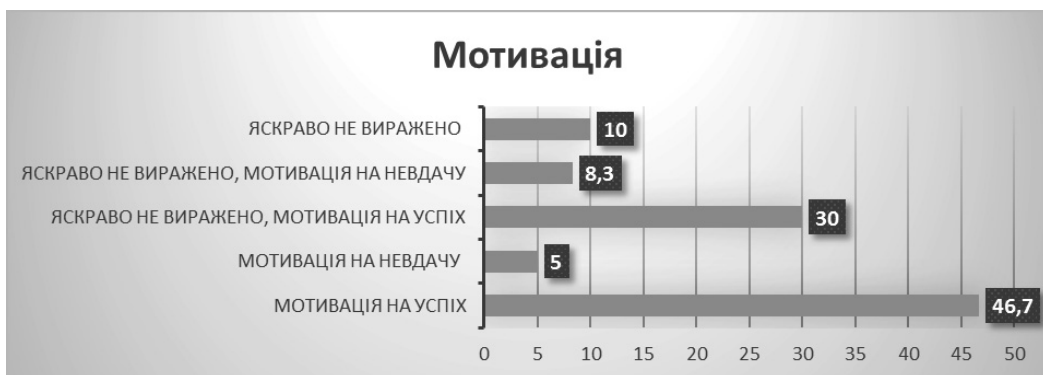
Рис. 2. Розподіл досліджуваних за мотивацією (Опитувальник Реана)

ве сімейне життя; впевненість в собі. До другого рангу цінностей увійшли: життєва мудрість; продуктивне життя; цікава робота; активне життя; свобода; розвиток. До третього рангу цінностей увійшли: щастя інших; краса природи і мистецтва; задоволення, розваги; творчість; пізнання. (рис. 4)