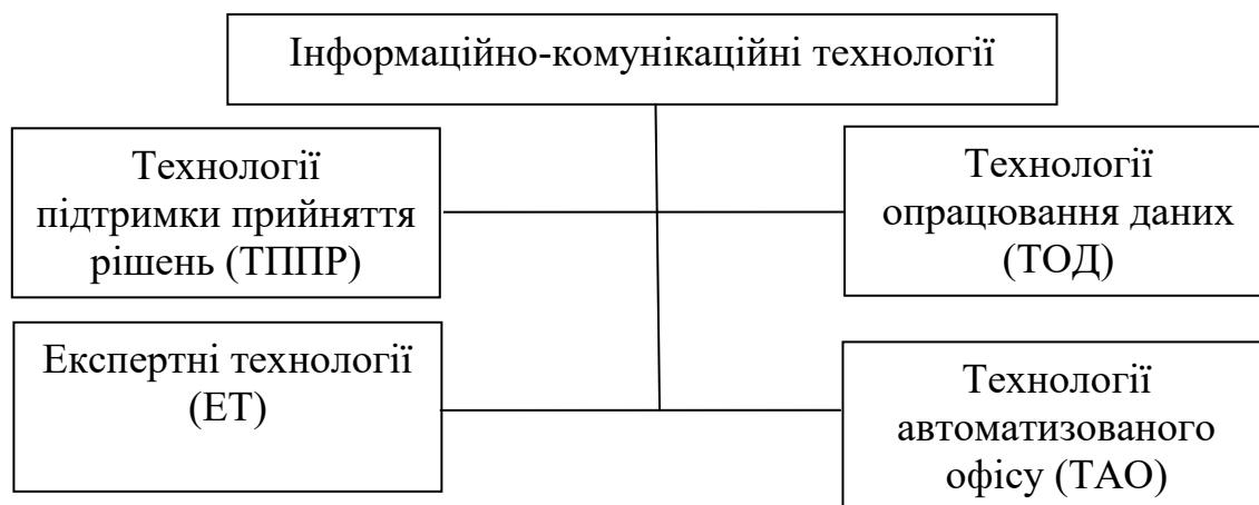
Рис. 1. – Класифікація інформаційно-комунікативних технологій.

Розвиток інформаційно-комунікаційних технологій (ІКТ) зумовив їх різноманіття в залежності від їхнього призначення (рис. 1).