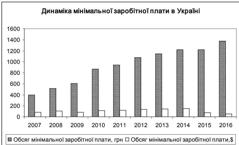
Рис. 2. Динаміка мінімальної заробітної плати в Україні

Наведені дані засвідчують закономірний зв'язок між середньою заробітною платою та обсягом виробництва на душу населення в країні. З усіх європейських