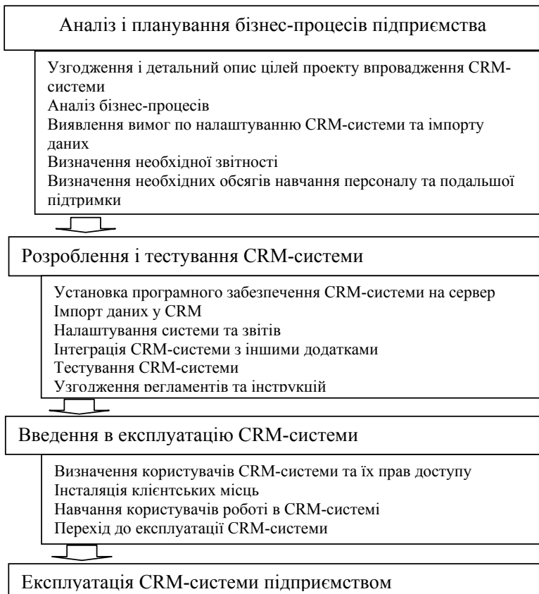
Рис. 2. Основні етапи впровадження CRM-технологій у системі внутрішнього маркетингу

Третій етап – підготовка до експлуатації CRM-системи. Коли CRM-система фактично готова до експлуатації, необхідно позначити всіх її користувачів і надати їм право доступу до інформації. У процесі освоєння та навчання персоналу досягається головна мета – забезпечення ефективного використання всіх можливостей