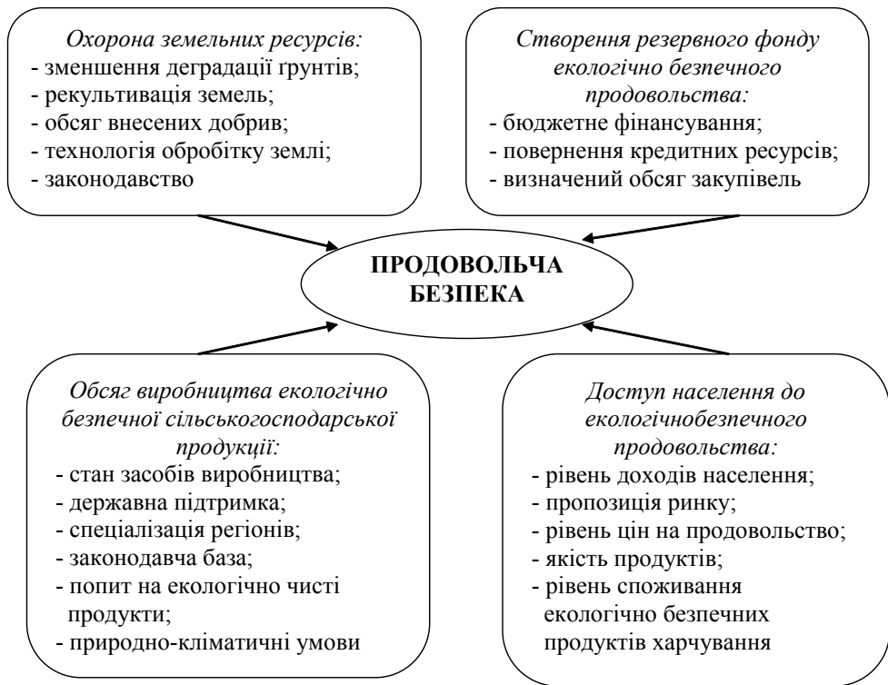
Рис. 1. Основні фактори, що забезпечують рівень продовольчої безпеки