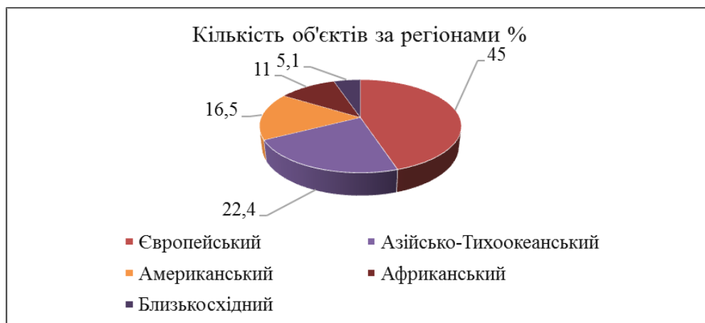
Рис. 2.2. Розподіл об'єктів всесвітньої спадщини ЮНЕСКО за туристичними макрорегіонами ЮНВТО

Рисунок 1.3 означає: третій рисунок першого розділу.