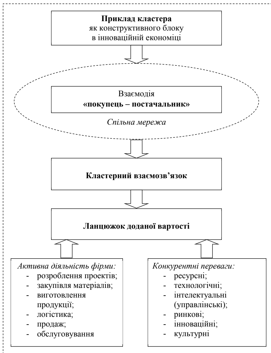
Рис. 1. Приклад кластера в інноваційній економіці

ництв стала значна структурна зміна світового експорту на користь продукції високо- і середньотехнологічних галузей для інноваційно активних країн (Японії, США і більшості країн ЄС).