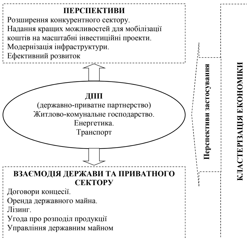
Рис. 3. ДПП у системі кластеризації економіки