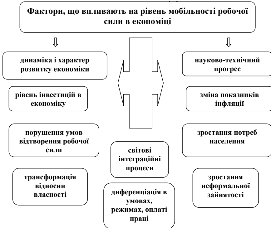
Рис. 1. Фактори, що впливають на рівень мобільності робочої сили в економіці

Так, у період підйому, коли створюються нові робочі місця, розширюється потенційне середовище для пересування працівників, що збільшує мобільність. Економічний спад скорочує робочі місця, зростає безробіття, знижуються можливості пошуку нового місця роботи, що стримує трудову мобільність.