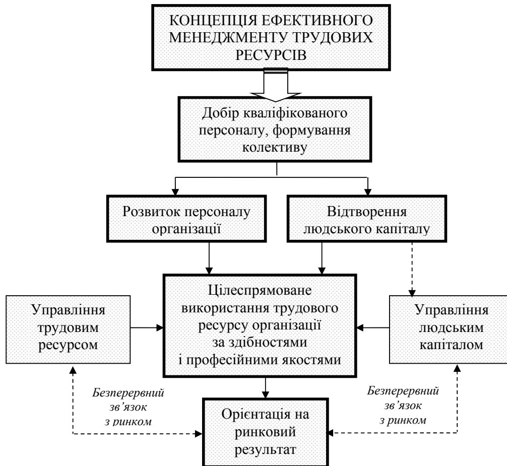
Рис. 3. Концепція ефективного менеджменту трудовими ресурсами, що сформувалася у межах третього етапу її розвитку