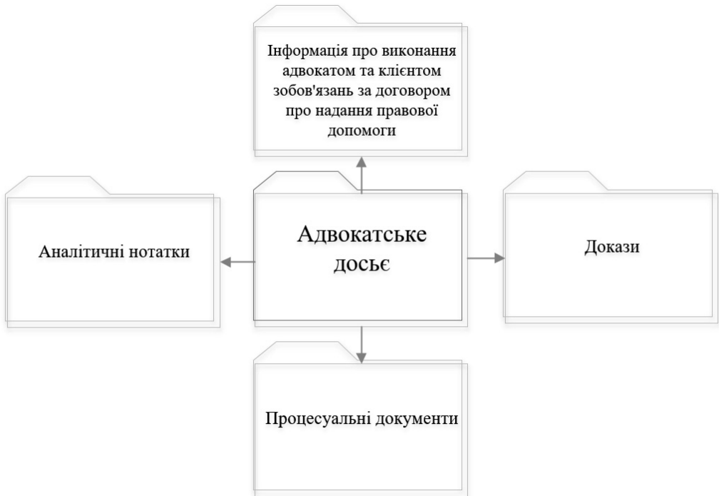
Рис. 1. Зміст адвокатського досьє