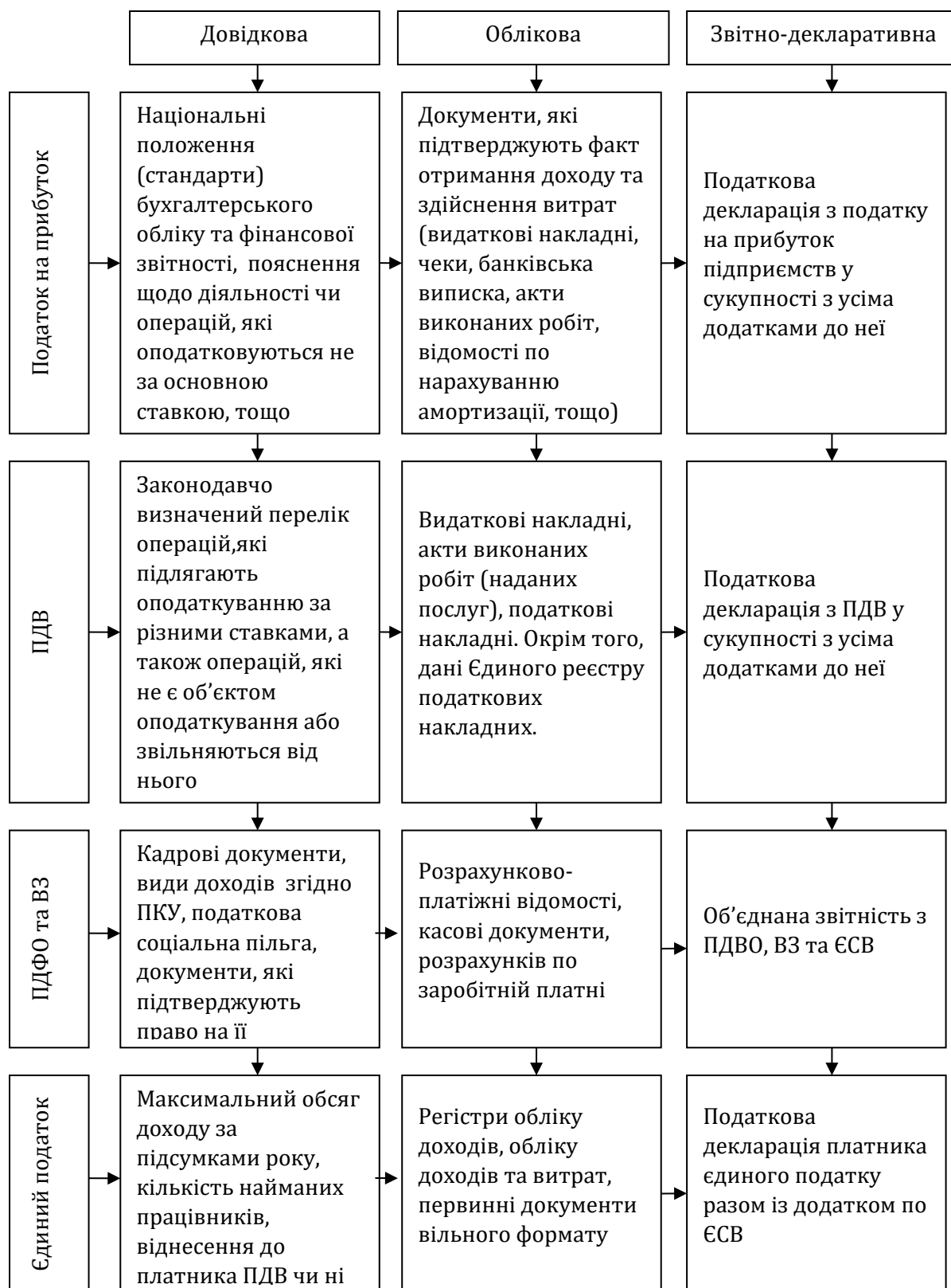
Рис. 2. Представлення довідкової, облікової та звітно-декларативної інформації у розрізі основних податків

в податковій сфері вносяться мало не щодня, і лише з використанням цифрових технологій можна оперативно їх відслідковувати.