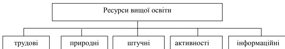
Рис. 2. Структура ресурсів вищої освіти

Однак, найбільш суттєва особливість економічного середовища суспільства, що визначає кризовий стан у вітчизняній освіті на ринку освітніх послуг, – недостатній загальний рівень доходів підприємств і недостатня купівельна спроможність населення, які безпосередньо пов'язані з ситуацією в країні останнім часом, а саме фінансовою кризою в усіх сферах економіки. Передумовою досягнення стабілізації економіки України у сфері вищої освіти є потенціал, що розглядається як сукупність усіх або частини наявних ресурсів і доданих до них сил. Роль потенціалу вищої освіти в забезпеченні економічної безпеки характеризується накопиченими ресурсами (рис. 2).