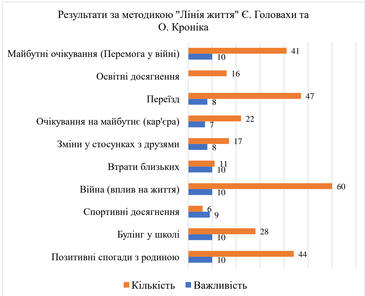
Рис. 2.4 Результати за методикою «Лінія життя» Є. Головахи та О. Кроніка

За проєктивною методикою «Лінія життя» Є. Головахи та О. Кроніка визначено головні події в житті підлітків. Результати зображені на рис.2.4.