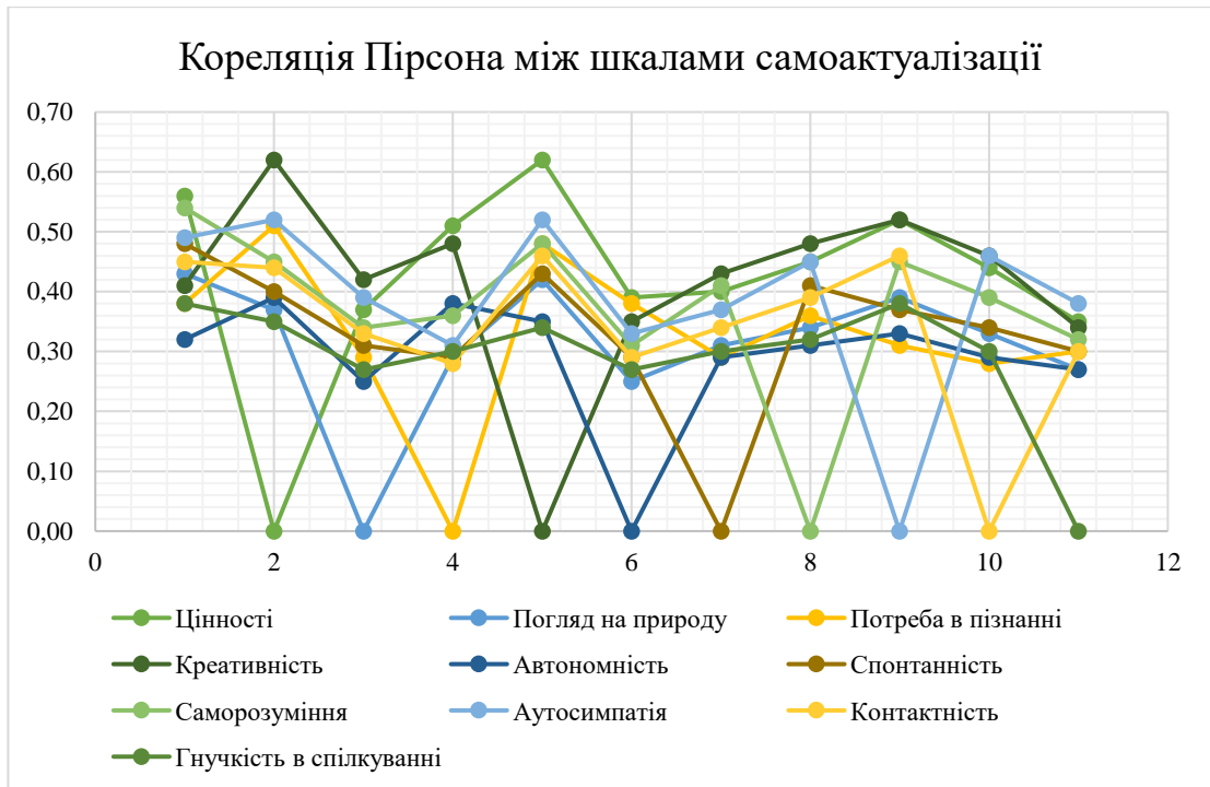
Рис. 2.2 Результати методики діагностики самоактуалізації особистості «САМОАЛ» з використанням кореляції Пірсона

Інші показники, такі як Потреба в пізнанні (8.00) та Креативність (8.33), мають дещо нижчі результати, але все одно є високими, тому вказують на активну життєву позицію підлітків. Вони відкриті до нового досвіду і готові до самовираження, що може стимулювати їхній інтелектуальний і творчий розвиток. Такі якості допомагають їм ефективно адаптуватися до змін, розвивати критичне мислення і знаходити нестандартні рішення.