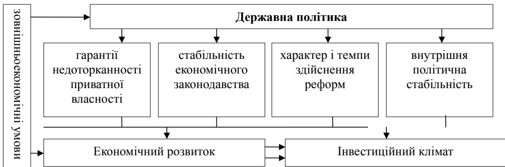
Рис. 2. Вплив державної політики на економічний розвиток країни

– з урахуванням історичної специфіки України бажаний перехід до американ-