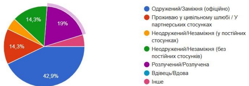
Рисунок 2.1 - Сімейний стан.