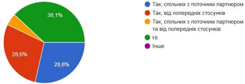
Рисунок 2.2 - Наявність дітей.

52,4% опитувальних описують атмосферу у своїй родині, коли були дитиною, як теплу та підтримуючою, безпечною та стабільною. Майже третина (28,6%) відчували в дитинстві самотність, навіть у присутності родини. Холодною та емоційно відстороненою атмосферою у родині називають 9,5%. А 19% респондентів вважають, що зростали в напруженій та конфліктній атмосфері.