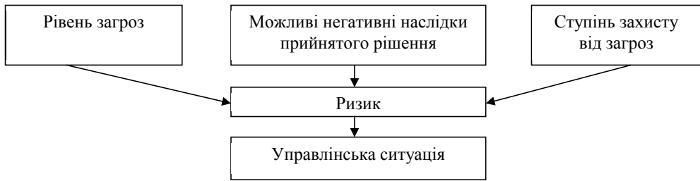
Рис. 1. Складові ризику