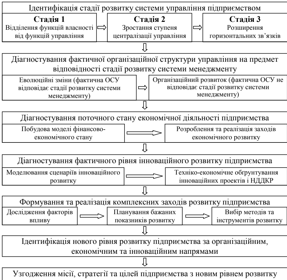
Рис. 2. Процес розвитку підприємств (загальна концепція)