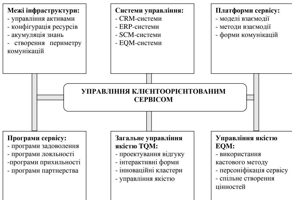
Рис. 1. Модулі управління клієнтоорієнтованим сервісом

Джерело: скомпоновано авторами на підставі [19]