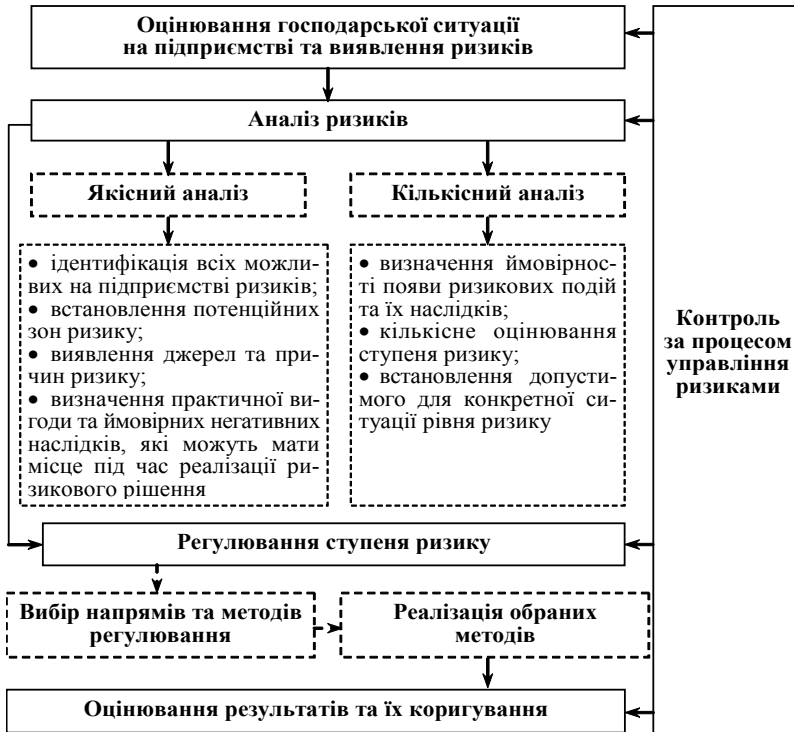
Рис. 2. Процес управління ризиками господарської діяльності на підприємстві