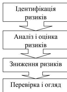
Рис. 3. Загальна схема управління ризиками

Етап визначення цілей – встановлення цілей і завдань для різних ієрархічних рівнів управління підприємством. Ідентифікація ризиків – визначення переліку тих ризиків підприємства, до яких воно може бути схильне, а також встановлення їх значущості (більш і менш важливі). Аналіз і оцінка ризиків – визначення