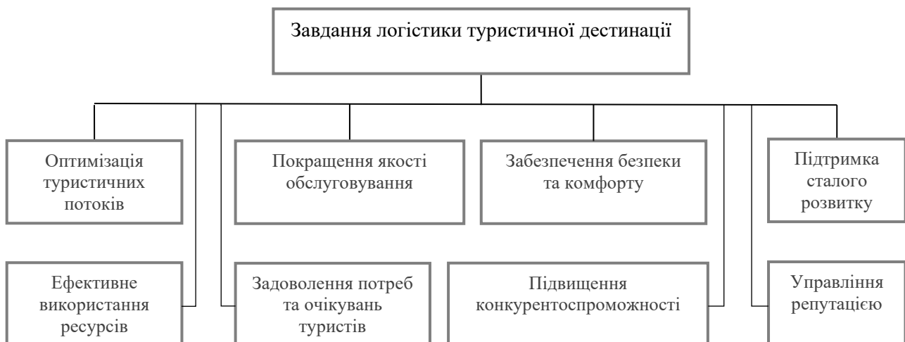
Рис. 2. Основні завдання логістики туристичної дестинації

Другий етап дослідження було присвячено систематизації та аналітичному опису мети й основних завдань логістики туристичної дестинації в межах системного підходу. Метою логістики туристичної дестинації вважаємо створення та постійне удосконалення умов і задоволення вимог щодо належного рівня безпеки, комфорту та ефективного обслуговування туристів. Використовуючи метод конкретизації, нами сформульовано основні завдання логістики туристичної дестинації, які наведено на рис. 2.