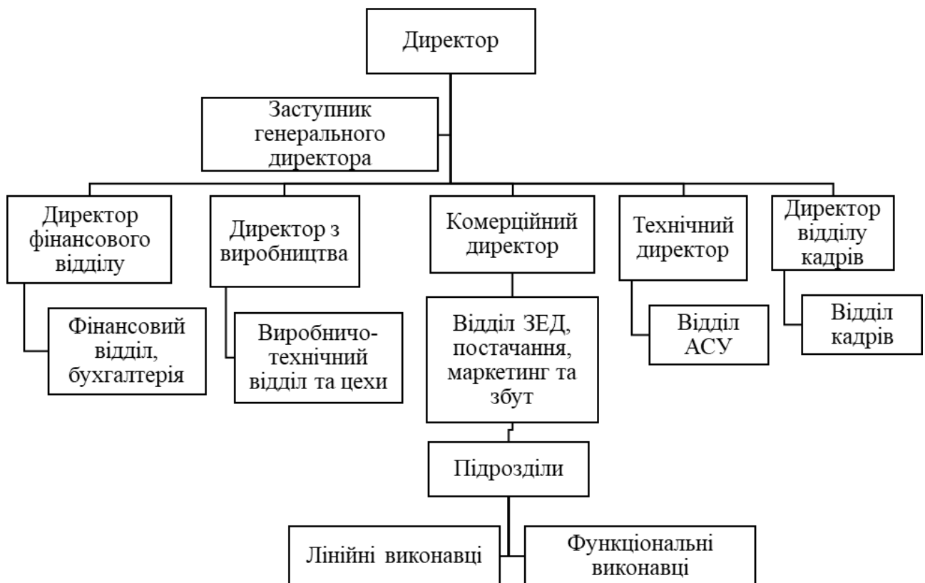
Рис. 2.1. Організаційна структура підприємства ПРАТ «Бердичівська фабрика одягу»

ПРАТ «Бердичівська фабрика одягу» має лінійно-функціональну організаційну структуру управління (Рис.2.1), це організаційна структура, в основу якої покладено розподіл повноважень та відповідальності за функціями управління і прийняття рішень по вертикалі. Така організаційна структура здійснює управління підприємством за лінійною схемою, а функціональні підрозділи підприємства допомагають лінійним керівникам вирішувати управлінські завдання.