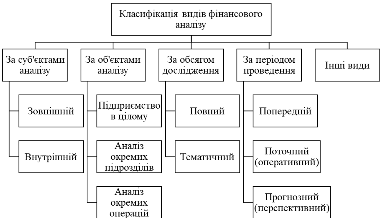
Рис. 1.2 Класифікація видів фінансового аналізу

Результати вивчення літературних джерел та власне бачення дають можливість сформуванню комплексної класифікації видів фінансового аналізу за сукупністю певних ознак, поданих на рис. 1.2.