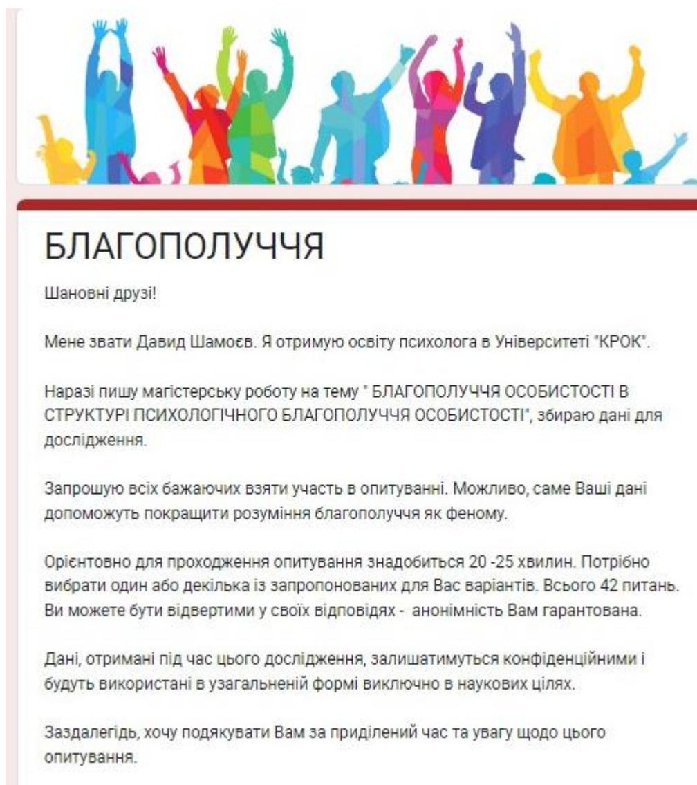
Рис. 1. Головна сторінка анкети – опитувальника «БЛАГОПОЛУЧЧЯ ОСОБИСТОСТІ В СТРУКТУРІ ПСИХОЛОГІЧНОГО БЛАГОПОЛУЧЧЯ ОСОБИСТОСТІ», представленого у Google формі

https://docs.google.com/forms/d/1NMgdHhTJcfJGzPZanUYKMZr3Y9mT4GQZ8mcnP1y-8N4/viewform?edit_requested=true#responses