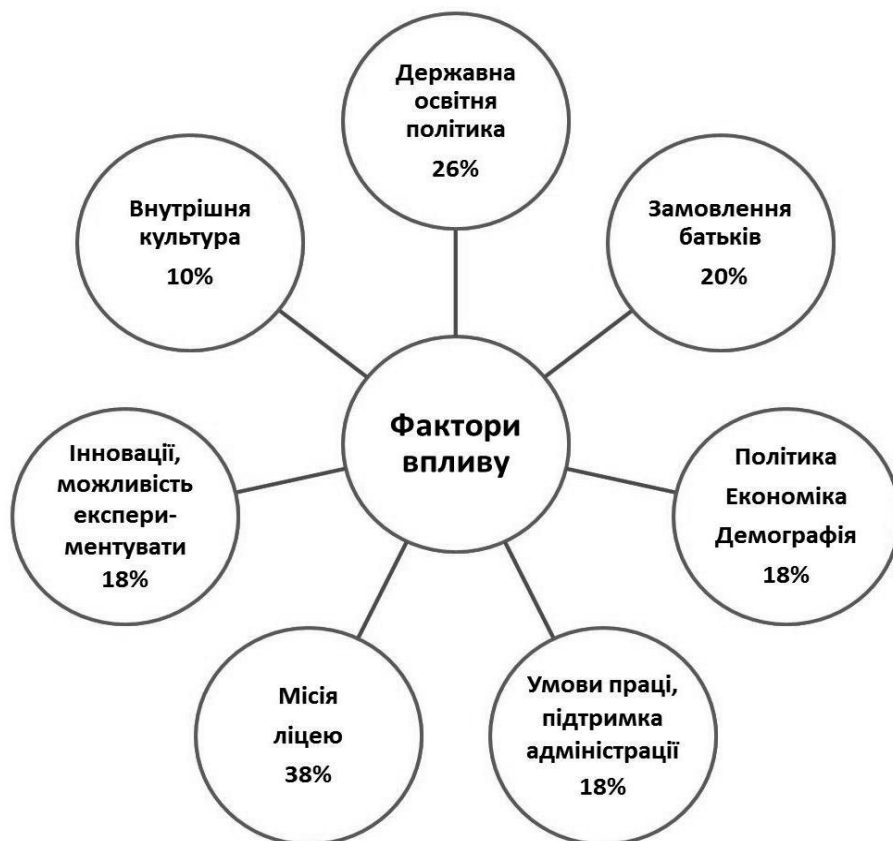
Рис. 2. Фактори впливу на мотивацію діяльності вчителів

силля спрямовані на формування педагогічного простору, сприятливого для самопрояву, самоорганізації, саморозвитку всіх ліцеїстів і вчителів. Особливий акцент в організаційній культурі ліцею зроблено на активізацію засад самоорганізації та саморозвитку як ключових цінностей сучасної