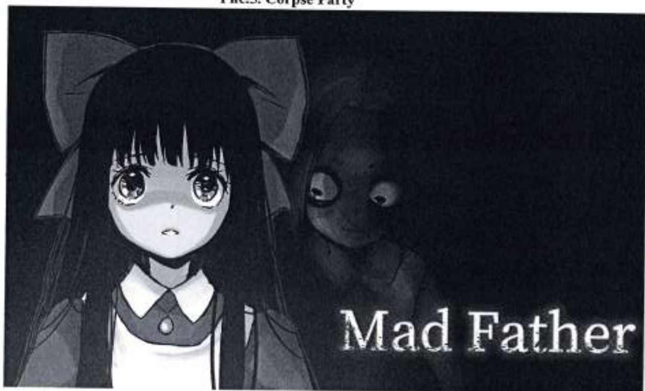
Рис.6. Mad Father