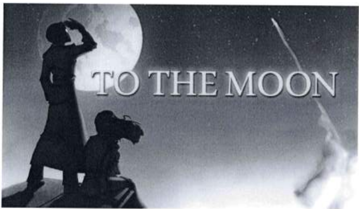
Рис.1. To The Moon