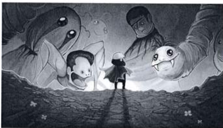
Рис.3. Lisa: The Painful

Опис: "Lisa: The Painful" – це постапокаліптична рольова гра з чорним гумором, яка розповідає історію Бреда Армстронга в його пошуках зниклої прийомної дочки.