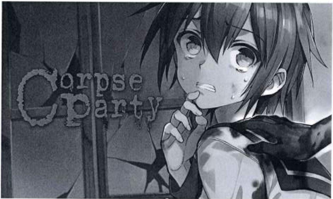
Рис.5. Corpse Party

Опис: "Corpse Party" – це жахастик з елементами візуального роману, який розповідає історію групи студентів, які опинилися у жахливій альтернативній реальності після виконання ритуалу. Гра відзначається своїм моторошним сюжетом, інтерактивністю та кількома можливими кінцівками. "Corpse Party" здобула популярність серед шанувальників жанру жахів і отримала кілька ремастерів та продовжень.