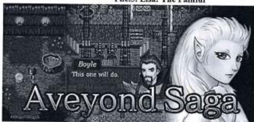
Рис.4. Aveyond Saga