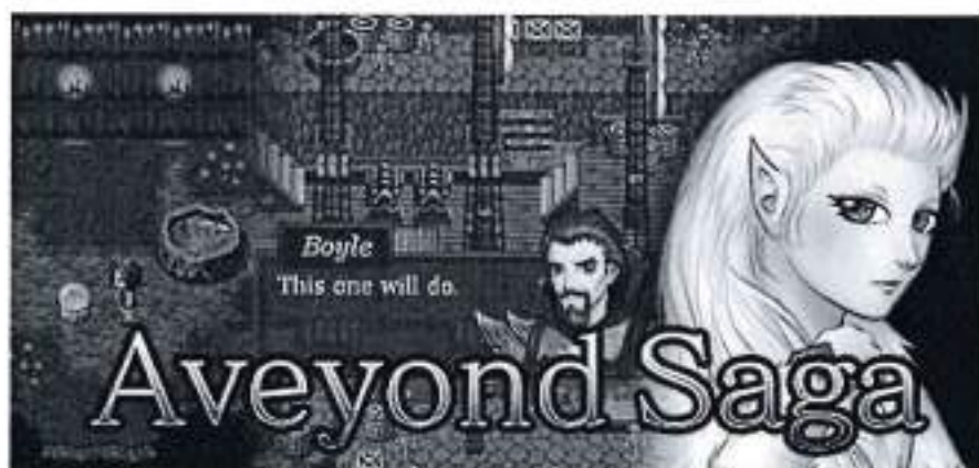
Рис.4. Aveyond Saga

Опис: Серія "Aveyond" включає кілька ігор, що поєднують класичний стиль JRPG з багатими сюжетами та геймплеєм. Гравці досліджують великі світи, виконують різні завдання та взаємодіють з численними персонажами. Ігри серії "Aveyond" здобули популярність завдяки своїм глибоким сюжетам, цікавим персонажам і класичному геймплею, що привертає шанувальників жанру.