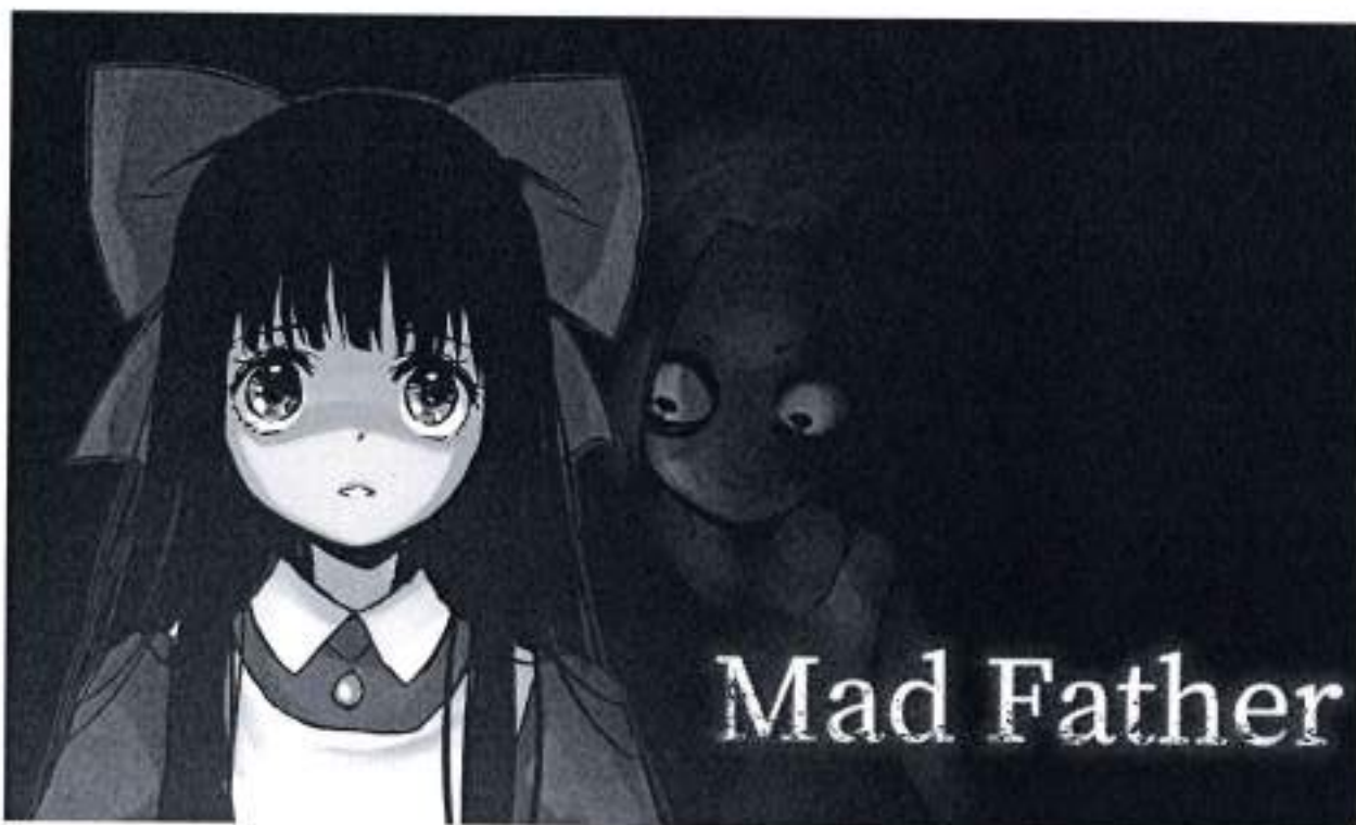
Рис.6. Mad Father

Опис: "Mad Father" – це пригодницька гра жахів, яка розповідає історію маленької дівчинки на ім'я Ая, що живе у великому будинку з таємницями і моторошними експериментами її батька. Гра вирізняється захоплюючим сюжетом, атмосферними графікою та звуком, а також численними головоломками. "Mad Father" стала дуже популярною серед шанувальників інді-ігор жахів.