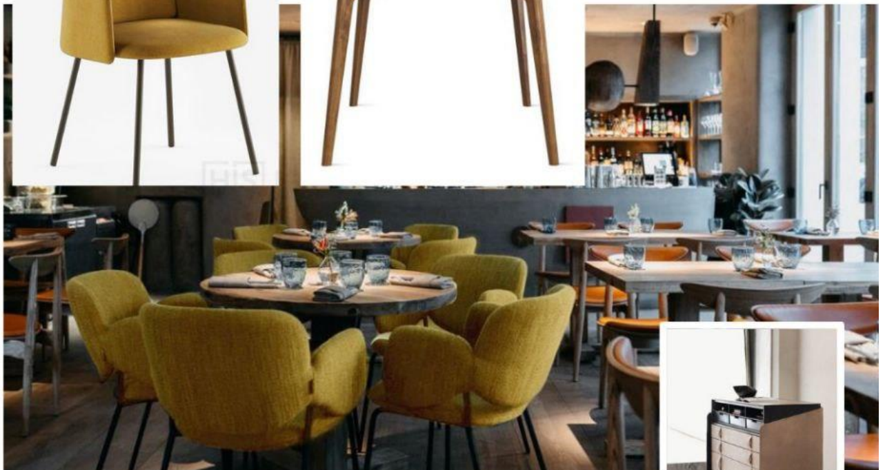
Дровер для офіціантів