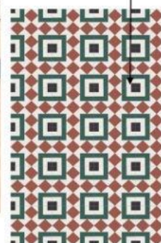
Плитка на стіні санвузлу