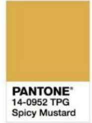
PANTONE® 14-0952 TPG Spicy Mustard