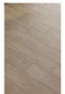
Підлога + стіни