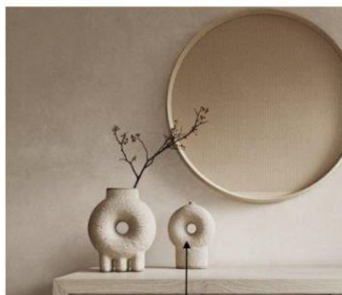
Декор, вази за українськими мотивами від Faina