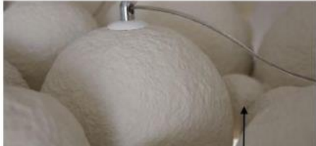
Люстра над столом