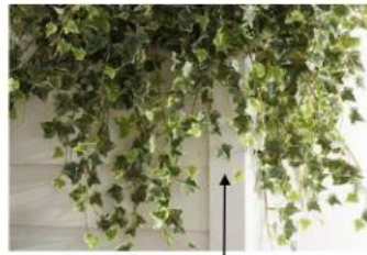
Озеленення на стіні з лед підсвіткою Світильники від Юлії Яланжи