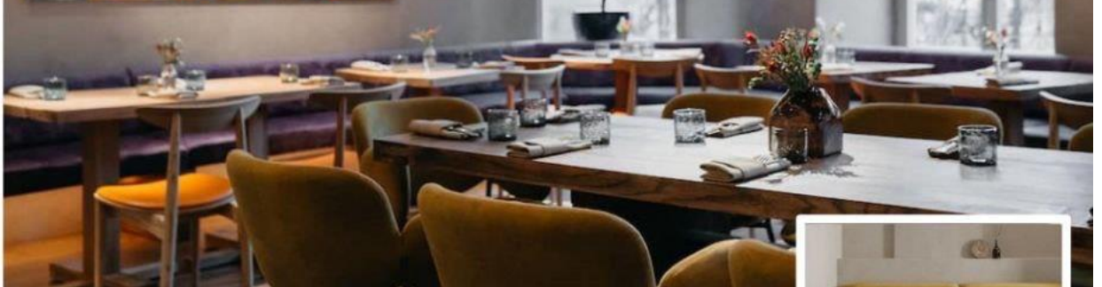
Концепт дивану фірми Donna, для посадочних місць, «використання без подушок»