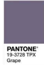
PANTONE® 19-3728 TPX Grape