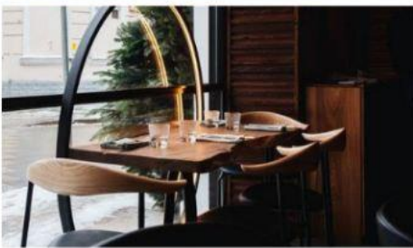
Півкруглі столики з Дерева під колір паркету