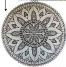
Штукатурка зі стилістичними образами