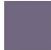
PANTONE® 19-3728 TPX Grape