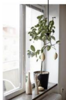
Рослини на стільниці