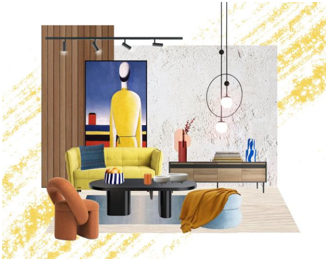
Рис. 5. Умовність трактування простору при створенні колажу