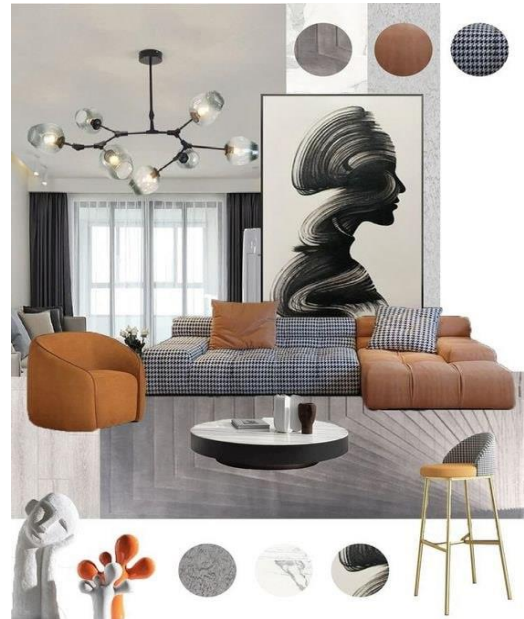
Рис. 6. Пошук образно-асоціативних властивостей простору засобами колажу