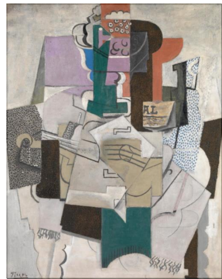
Рис. 2. П. Пікассо. Натюрморт зі скрипкою