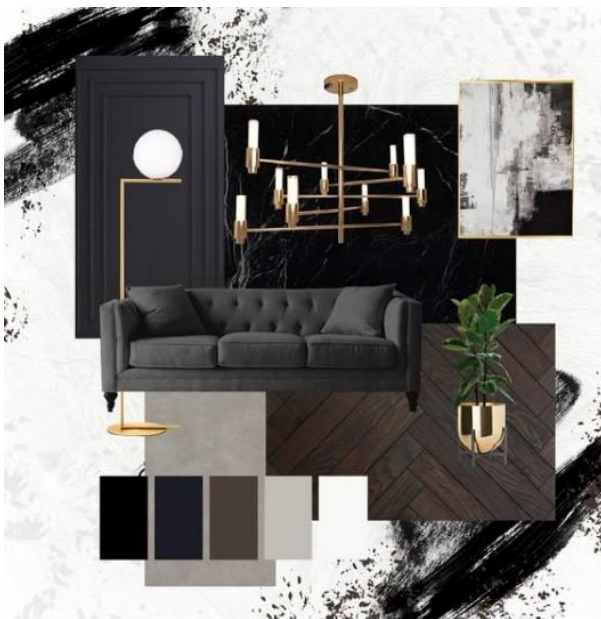
Рис. 7. Пошук образно-асоціативних властивостей простору засобами колажу