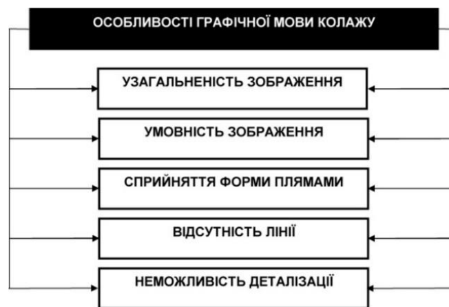
Рис. 4. Особливості графічної мови колажу

Зображення, виконані технікою колажу, мають свої специфічні риси, зокрема досить узагальнене і умовне зображення, вільна інтерпретація простору, свідоме раціональне «порушення» правил перспективи, моделювання форми локальними плямами при мінімальному використанні лінії (рис. 4).