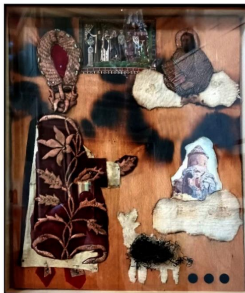
Рис. 3. Колажі Сергія Параджанова