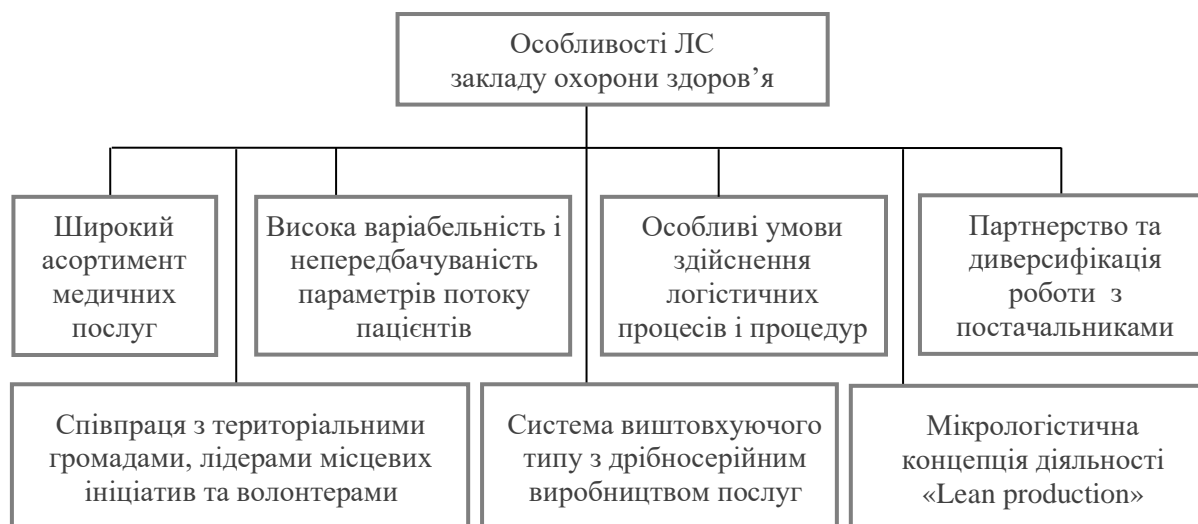
Рисунок 3 - Специфічні риси логістичної системи закладу охорони здоров'я

Виходячи із аналізу та синтезу реальних ЛС лікувально-профілактичних ЗОЗ нами сформульовано їх особливі риси наведені на рисунку 3. Як видно із рисунка 3 особливостями ЛС лікувально-профілактичного ЗОЗ є широкий асортимент медичних послуг. Це пов'язано з необхідністю забезпечення цим закладом широкого спектру послуг від профілактичних до базового лікування. Для вирішення завдань якості і доступності послуг та неперервного своєчасного і якісного їх надання ЛС повинна неперервно та оперативно забезпечувати наявність у операційному просторі закладу широкого спектру необхідних медичних засобів, ліків та обладнання для надання цих послуг.