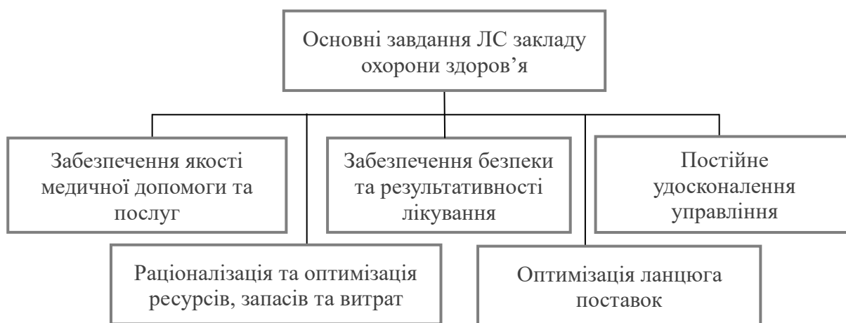
Рисунок 1 - Основні завдання логістичної системи закладу охорони здоров'я