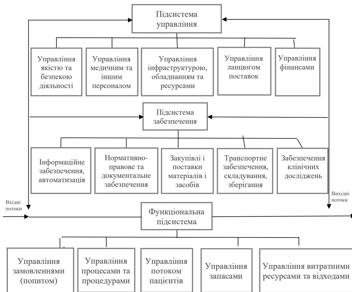
Рисунок 4 – Функціональна декомпозиція логістичної системи закладу охорони здоров'я

Останнім кроком на завершальному етапі дослідження було формування функціональної декомпозиції ЛС лікувально-профілактичного ЗОЗ. Функціональну декомпозицію ЛС закладу такого типу представлено на рисунку 4.