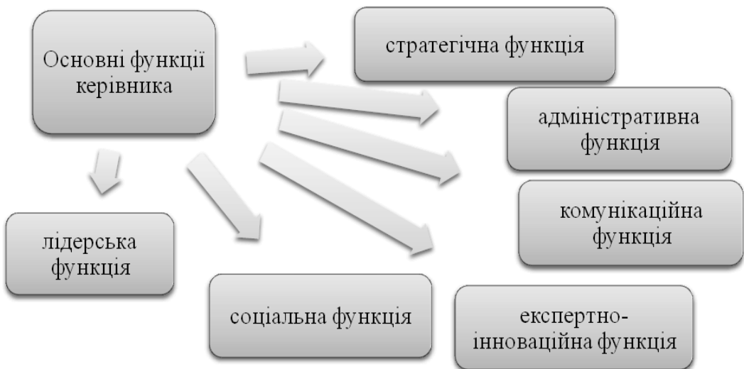
Рис. 1. Основні функції керівника приватного охоронного підприємства

Адміністративна функція керівника приватного охоронного підприємства включає в себе організацію діяльності з охорони об'єктів, поточну координацію сил і засобів охорони, контроль виконання охоронниками своїх функцій, оцінку результатів, матеріально-технічне забезпечення охоронної діяльності, управлін-