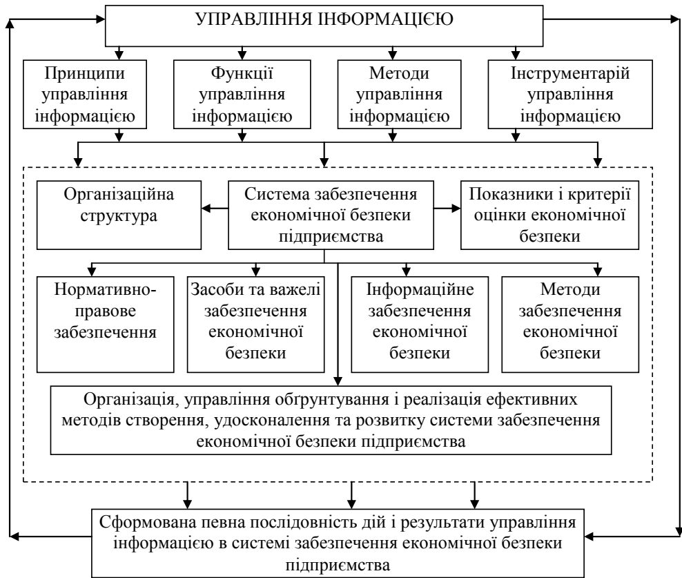
Рис. 1. Схема процесу управління інформацією в системі забезпечення економічної безпеки підприємства