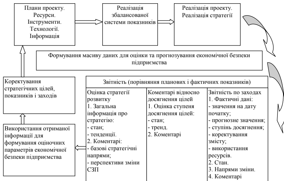
Рис. 3. Модель використання інформації при оцінці та прогнозуванні економічної безпеки підприємства з використанням елементів збалансованої системи показників

процедур і механізмів обробки інформації та отримання фактичних значень по показниках економічної безпеки для цілей проведення планфактного контролю і в розробленні процесів коректування стратегічних цілей і показників (рис. 3).