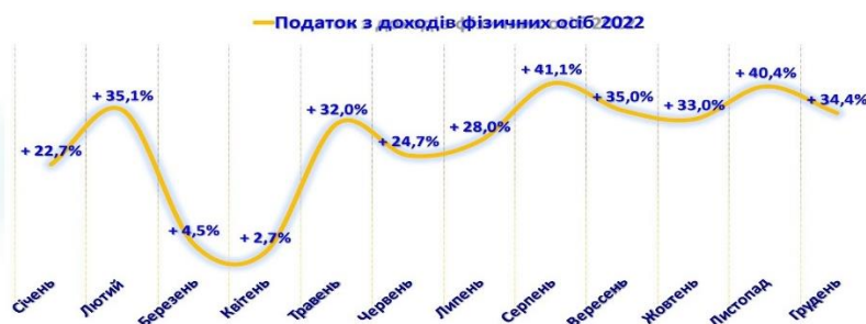
Рис.2. Динаміка надходжень ПДФО до місцевих бюджетів.