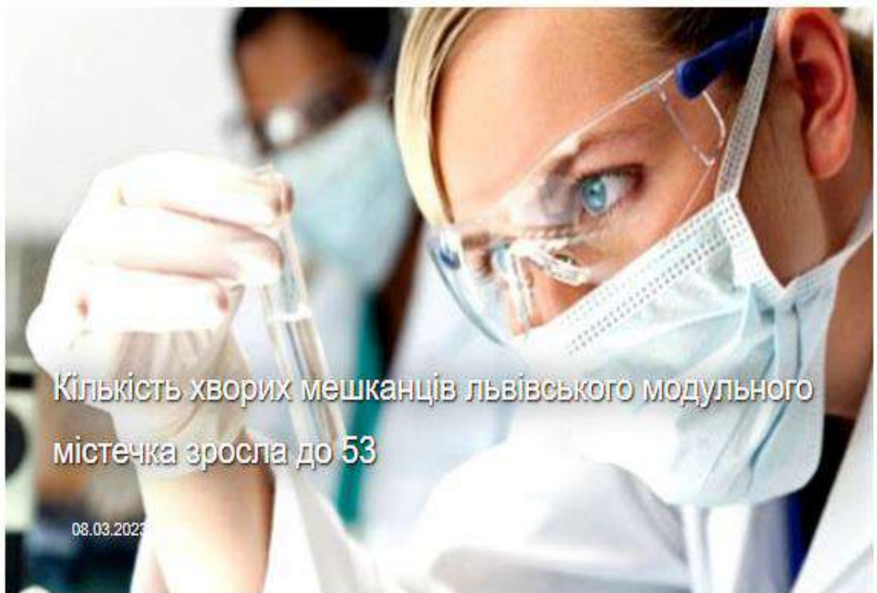
Рис. 2.7. Фото зі статті «Кількість хворих мешканців львівського модульного містечка зросла до 53»

За допомогою фото також здійснюється маніпуляційний вплив на читачів в таких темах, як спорт і краса. До матеріалів про моду, красу чи спорт зазвичай використовують фото гарних, струнких жінок і чоловік. У стаття про спорт можна часто зустріти фото чоловіків із голим торсом (рис.2.8.). Така маніпуляція зазвичай розрахована на жіночу частину аудиторії. Аргументація замінюється нав'язуванням набору стереотипів – ілюзорних, поверхових і стандартизованих уявлень про явища громадського життя. Вони діють як стимули, що викликають рефлекс симпатії чи антипатії.