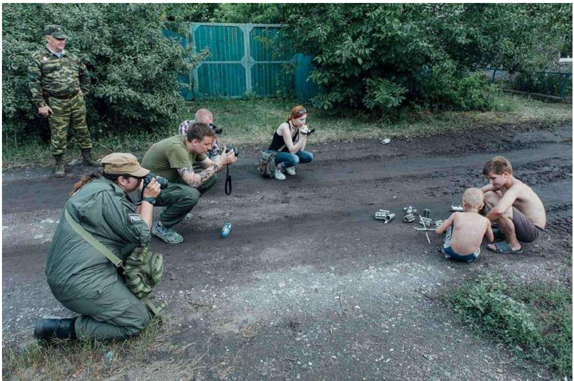
Рис. 2.11. Постановочна фотографія з дітьми на Донбасі для російського пропагандистського медіа

На жаль, не тільки російські ЗМІ займаються маніпулюванням правдивістю фотографій. Аналіз використання фотоматеріалів у висвітленні