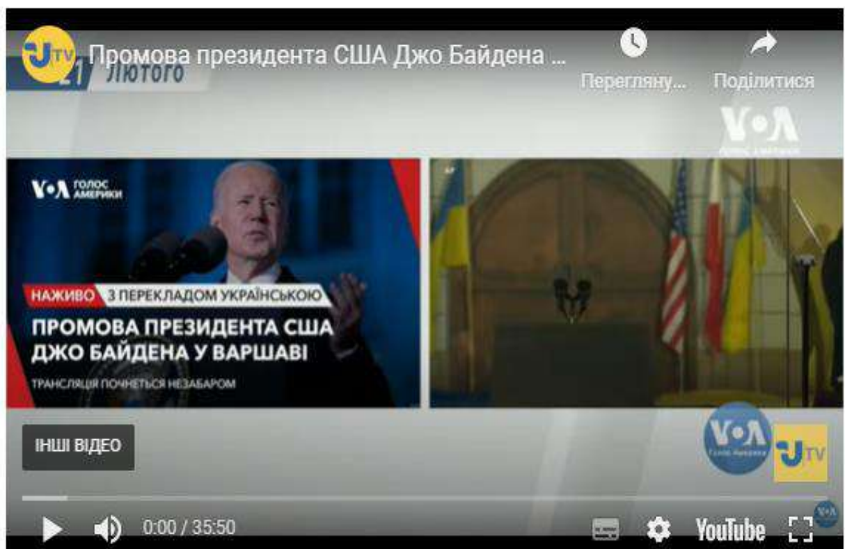
Рис. 2.4. Приклад відео

Укрінформ активно використовує мультимедіа, тим самим доповнюючи свої матеріали інформацією та роблячи їх цікавішими. Однак, на сайті представлено мало способів мультимедійної візуалізації. Хоча на сайті є можливість їх реалізації. Вважаю, що видання використовує свої можливості не в повному обсязі. Використання різних форм мультимедійного контенту, на мій погляд, підвищило б якість візуального контенту.