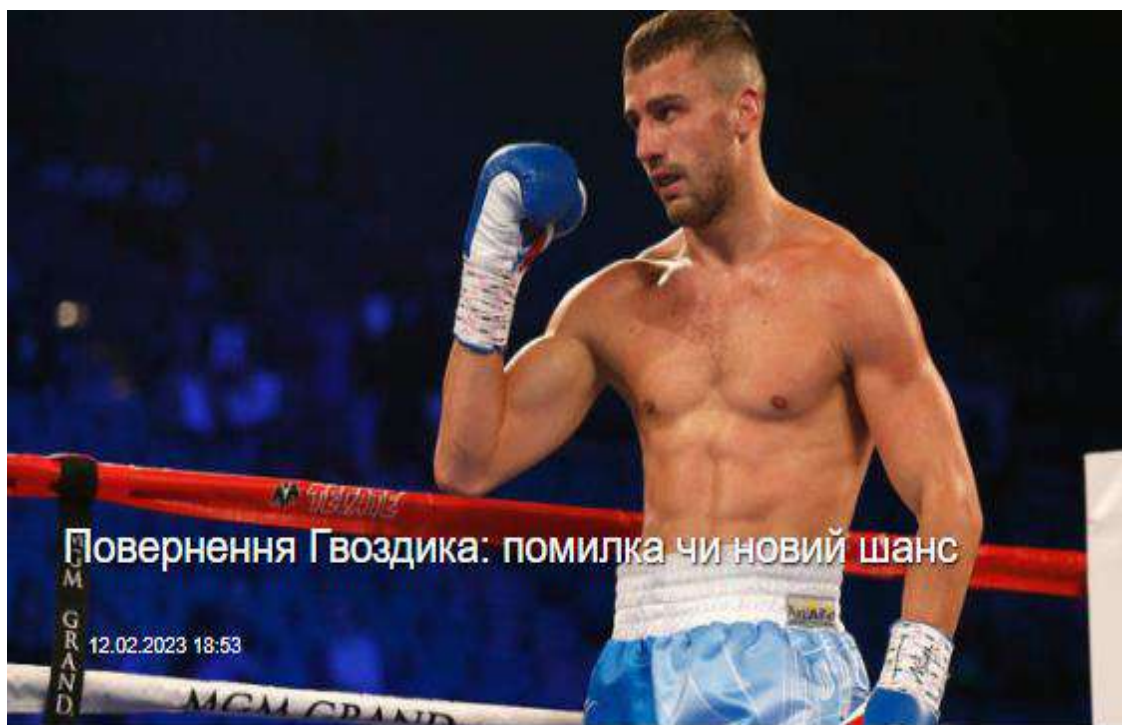
Рис. 2.8. Фото зі статті про спорт

Подаючи репортажі про державне свято День вишиванки, Укрінформ подавав фото як керівників країни в контексті події, так і пересічних жителів. Цей візуальний ряд викликав позитивні емоції (рис.2.9.)