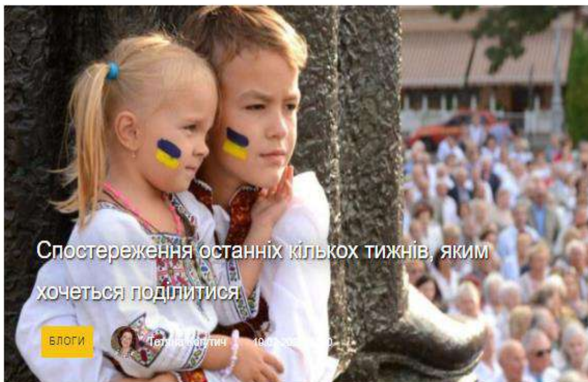
Рис. 2.6. Фото дітей зі статті

Дуже часто для маніпуляцій у ЗМІ використовують фото дітей для привернення уваги, наприклад в статті «Спостереження останніх кількох тижнів, яким хочеться поділитися». На обкладинці статті використовується зображення дітей (рис. 2.6.).