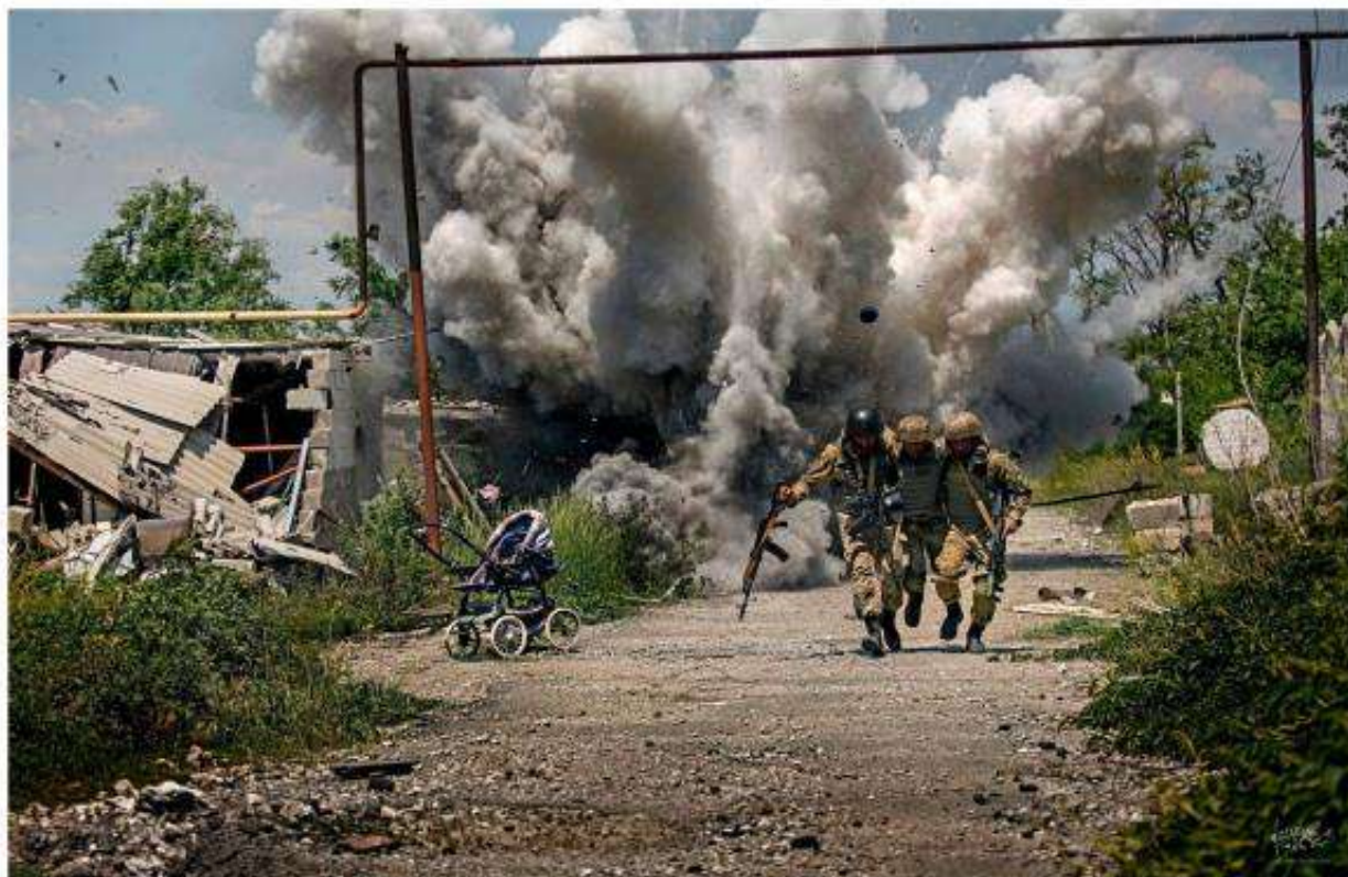
Рис. 2.12. Дмитро Муравський. «Перемир'я в Широкиному». Постановочна фотографія

Юрій Бутусов, головний редактор сайту ЦЕНЗОР.нет, опублікував цю ж світлину авторства Муравського на своїй сторінці 17 серпня 2016 року, закликавши розповсюджувати цю фотографію та надсилати її на фотоконкурси, щоб увесь світ дізнався про події під Маріуполем. Бутусов також зазначив, що це фото було зроблено у селищі Широкине 4 червня 2016 року.