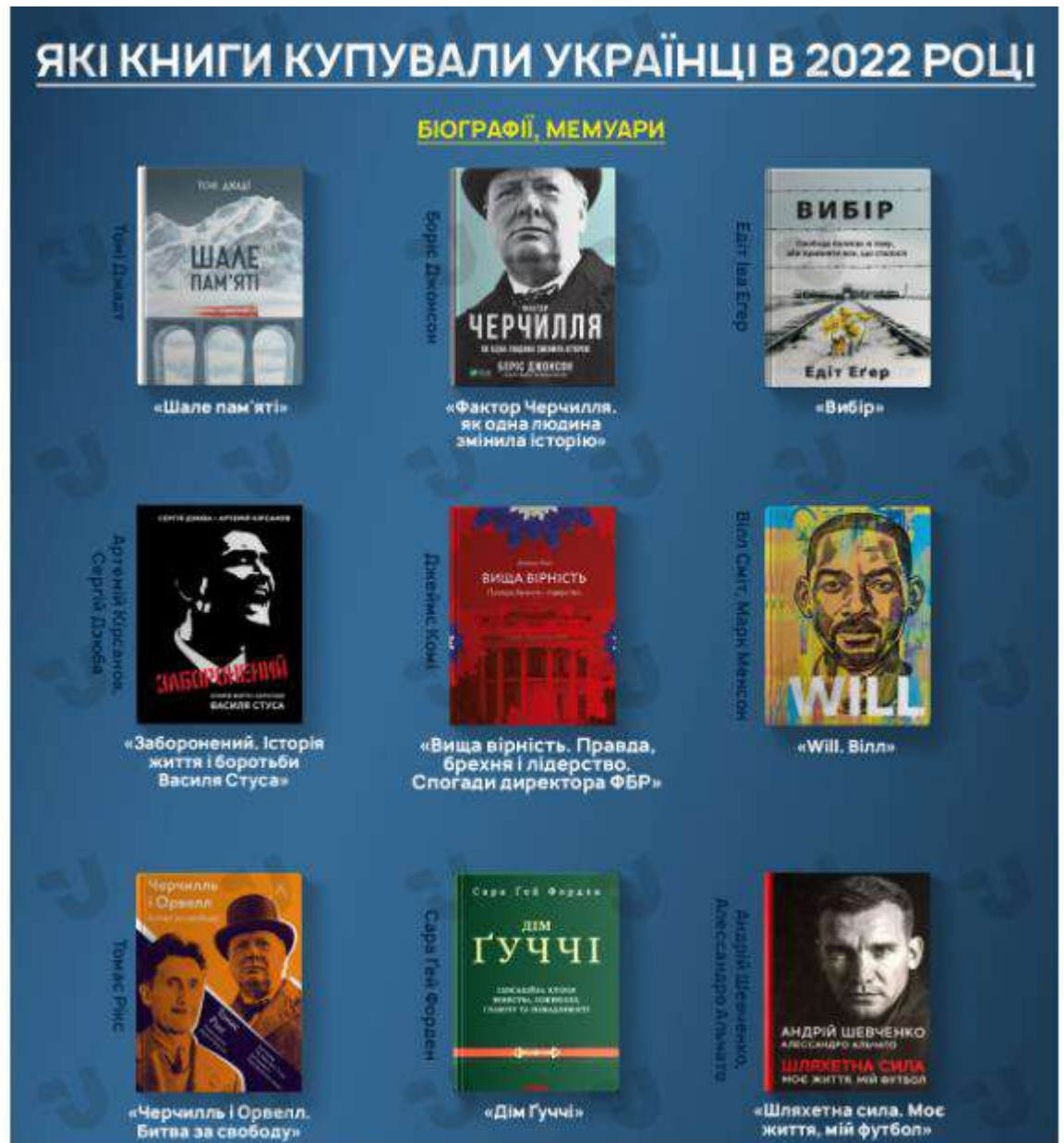
Рис. 2.3. Приклад інфографіки

Щодо тенденцій візуалізації контенту, можна побачити, що частка візуального контенту в загальній кількості матеріалу видання зростає. Можна також спостерігати поступове зменшення кількості текстових матеріалів відносно візуального контенту.