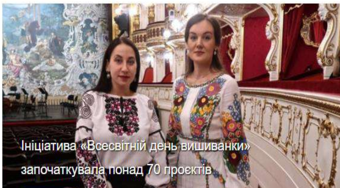
Рис. 2.9. День вишиванки

Подаючи репортажі про державне свято День вишиванки, Укрінформ подавав фото як керівників країни в контексті події, так і пересічних жителів. Цей візуальний ряд викликав позитивні емоції (рис.2.9.)