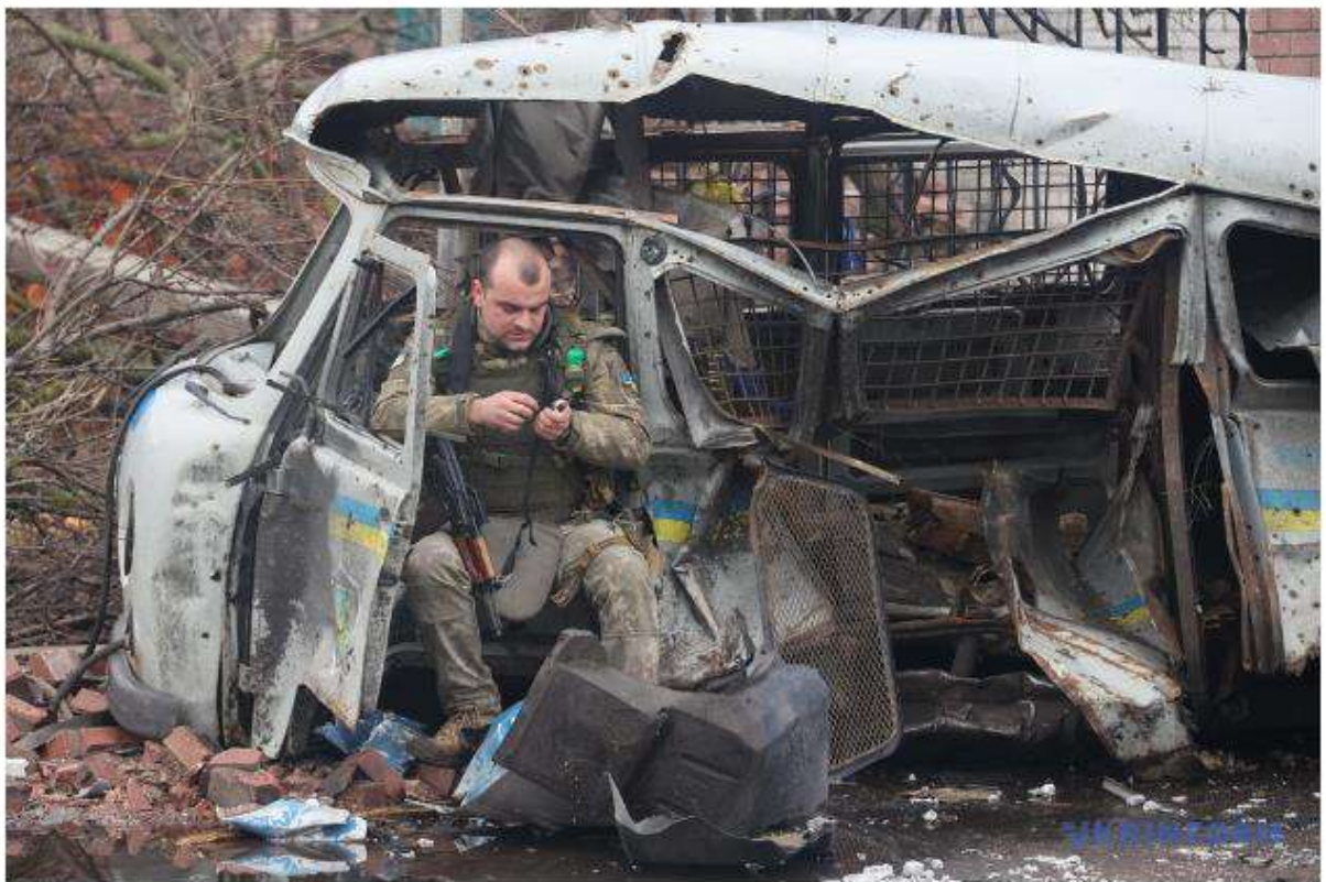
Рис. 2.1 Приклад фотографії

На сайті «Укрінформ» інфографіка подається окремим розділом (рис.2.2).