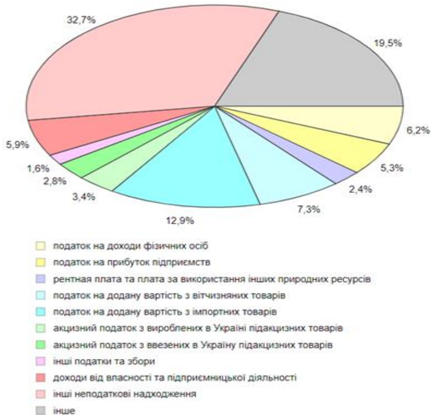
Рис. 3.2. Структура доходів Державного бюджету України на 1.10.2023 за найбільш вагомими показниками

Структура доходів Державного бюджету України наведено на рис. 3.2.