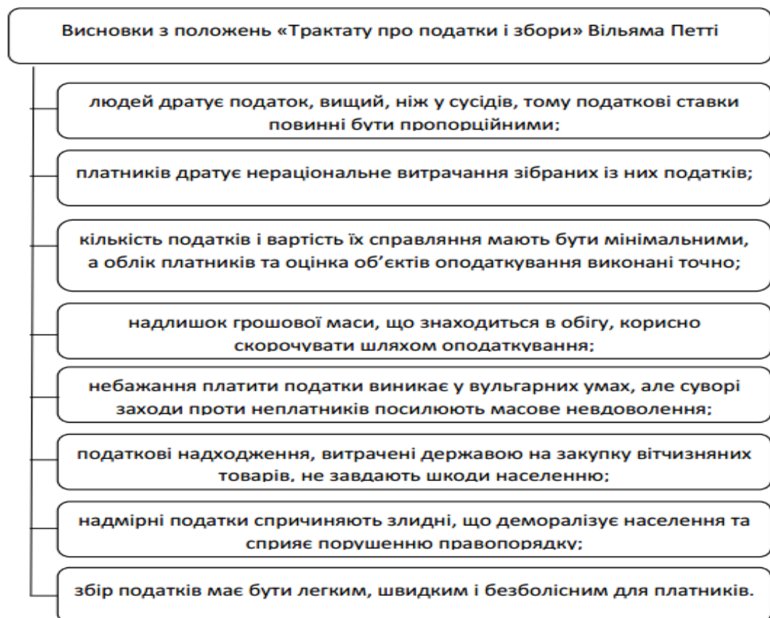
Рис. 1.1. Основні висновки із положення теорії оподаткування англійського економіста Вільяма Петті

З положень «Трактату про податки і збори» можна сформулювати певні висновки (рис. 1.1).