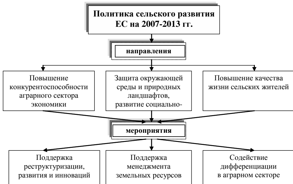
Рис. 1. Основные перспективы политики сельского развития ЕС на программный период 2007-2013 гг.