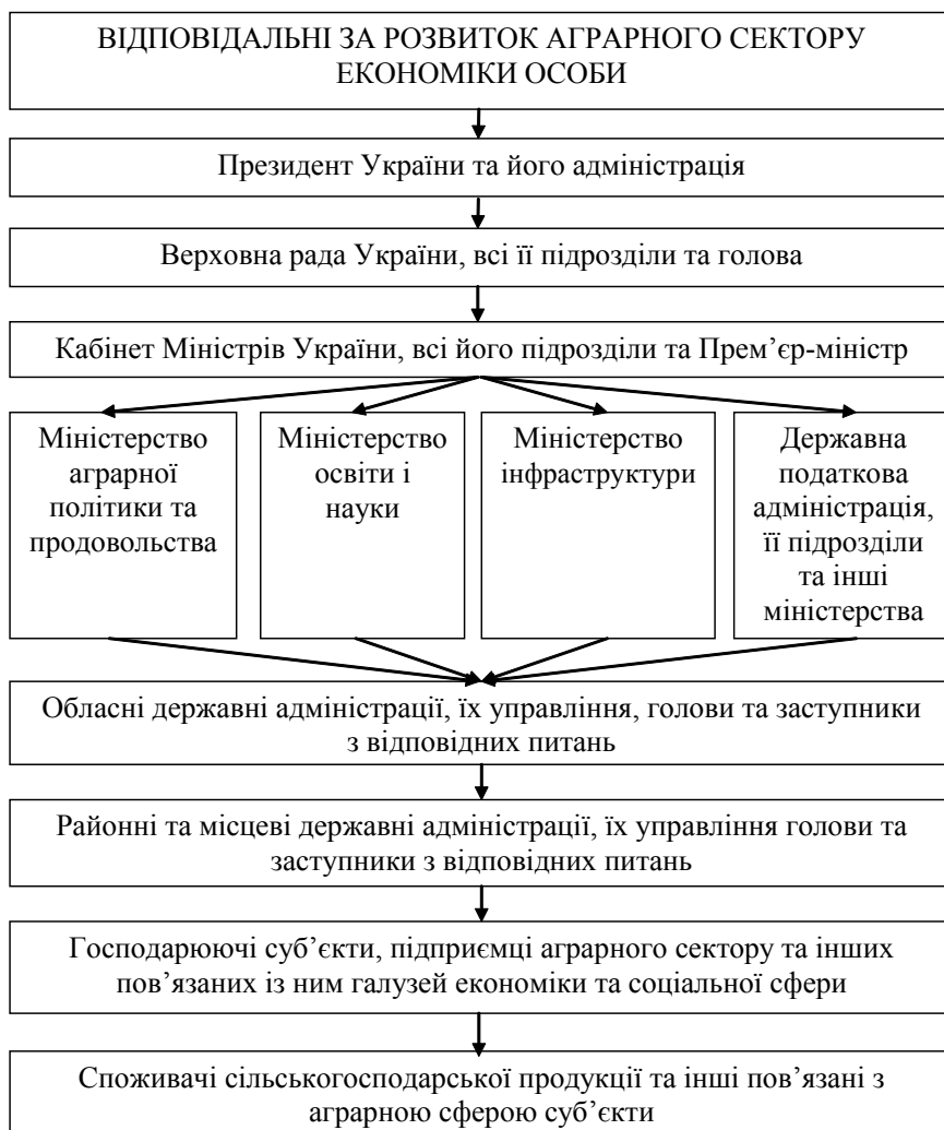
Рис. 2. Структура груп суб'єктів, відповідальних за формування ефективного відтворення ресурсного потенціалу аграрного сектору економіки*