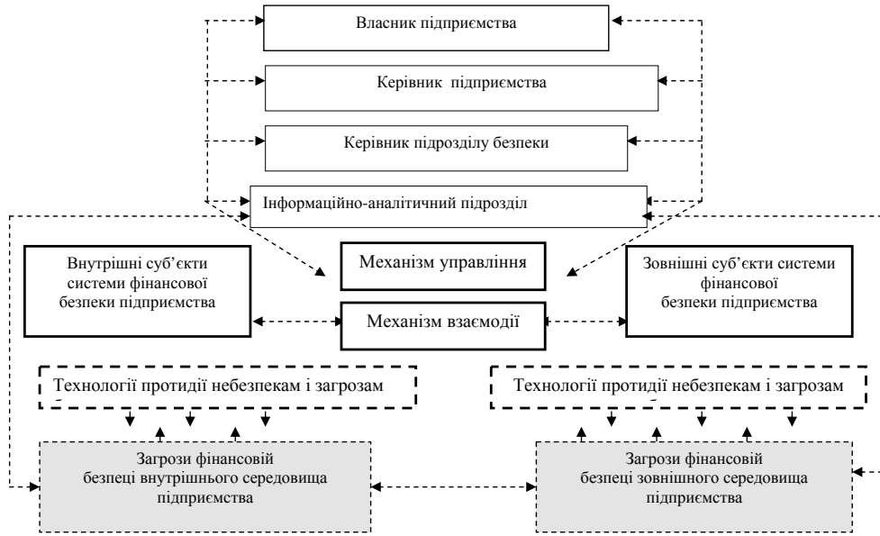
Рис. 2. Модель функціонування системи фінансової безпеки підприємств птахівництва