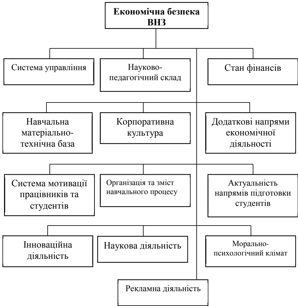
Рис. 2. Основні компоненти внутрішнього середовища, які впливають на економічну безпеку ВНЗ