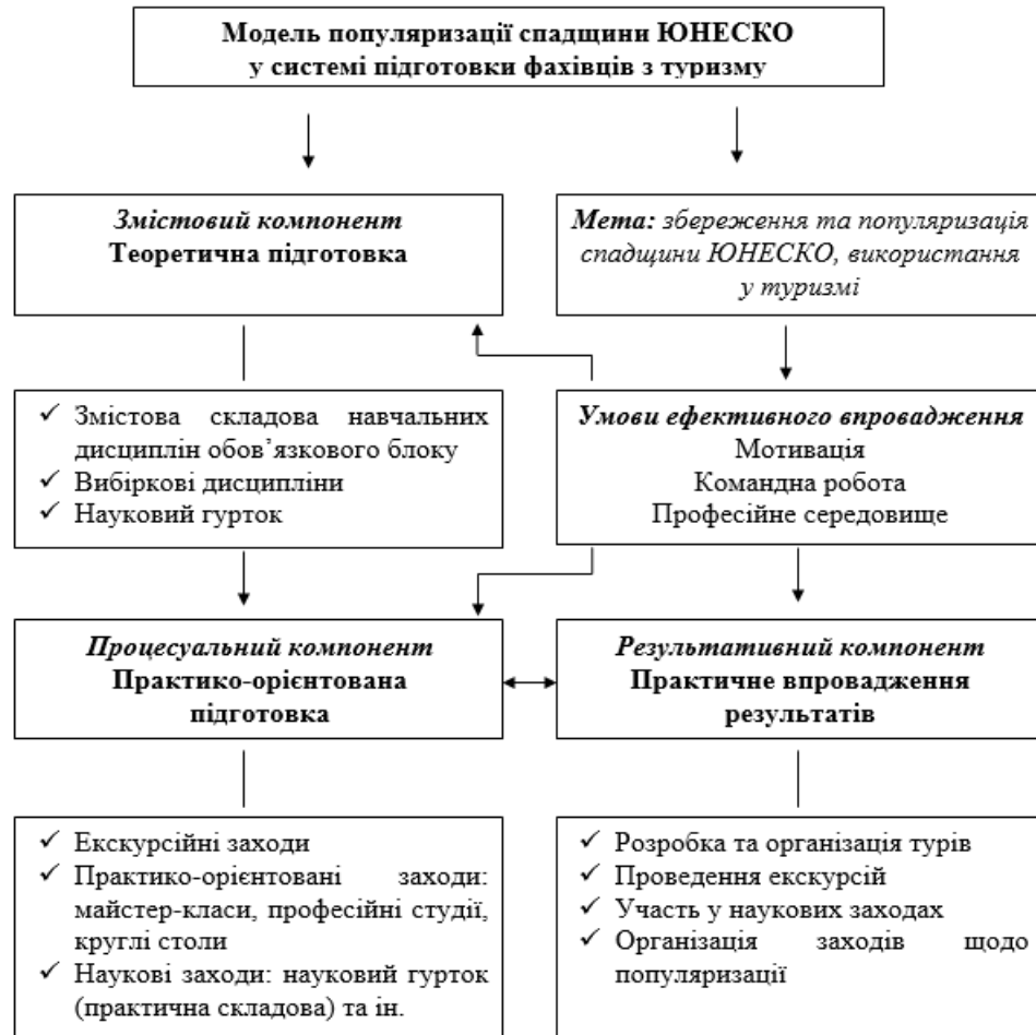
Рис. 1. Модель популяризації спадщини ЮНЕСКО у системі підготовки фахівців з туризму