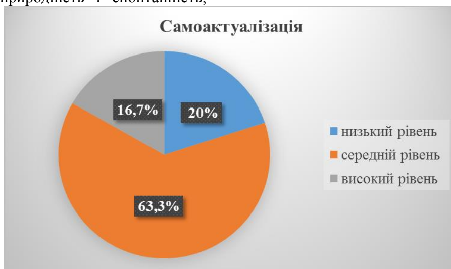
Рисунок 1. Рівень розвитку самоактуалізації досліджуваних зрілого віку

вміють керувати іншими та спрямовувати свою енергію на ефективне досягнення своїх цілей, також вони відкриті до всього нового, інноваційного. Варто тут зауважити, що у свій час А. Маслоу, наприклад, за результатами власних досліджень стверджував про те, що самоактуалізованими є лише менше 1% людей [9].